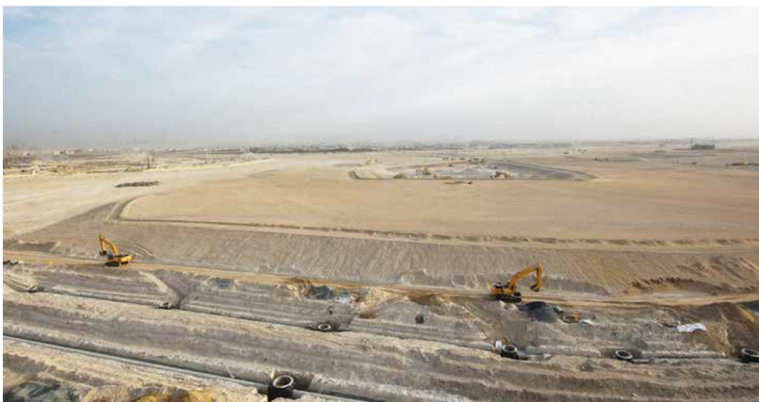
Expo 2020 Dubai site, Dubai South District

האתר מיועד להכיל עד 300,000 מבקרים ביממה, וסה"כ למעלה מ-50 מיליון איש. המארגנים מצפים כי בתערוכה יבקרו 25 מיליון, רובם מקומיים וממדינות שכנות, אך גם תיירים ואנשי עסקים זרים.